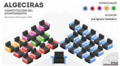
Pie de foto

Últimos vídeos de Andalucía : 'El amor no se mide', nueva campaña de la