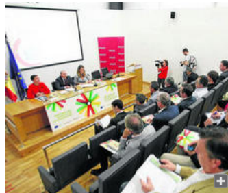
Un momento de la apertura de las jornadas a lo largo de la mañana de ayer en la Cámara de Comercio.